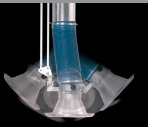
Fleksibelt drejeled (360°)