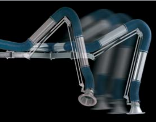
Standardarm kan forlænges op til 8 meter