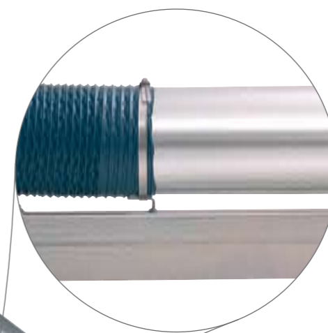
Lav luftmodstand med minimalt støjniveau