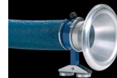
Slangeforlænger med magnetfod, for udsugning i tanke og ved store konstruktioner