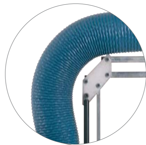
Pantograf med gasdæmpere der sikrer en stabil arm