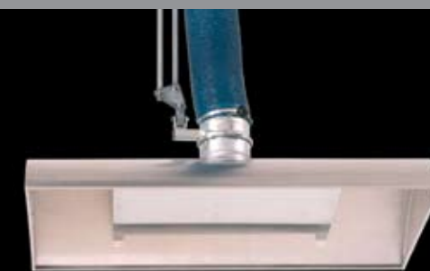
Udskiftelige emhætter for udsug over f.eks. euro-paller

Tilbehør der monteres med snapkobling på udsugningsarm