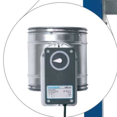
Motorspjæld for automatisk styring. Denne funktion giver en markant energibesparelse