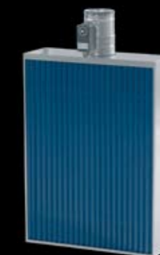
Flytbar sugepanel for afdunst- og slibe-udsugning ved emner