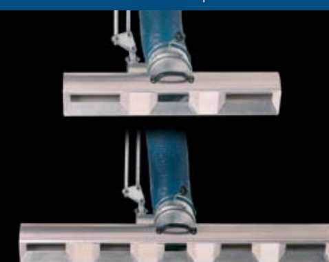
Udskiftelig sugetragt for længde-sug ved f.eks. ophæftning, længde-svejsning eller afdunstning